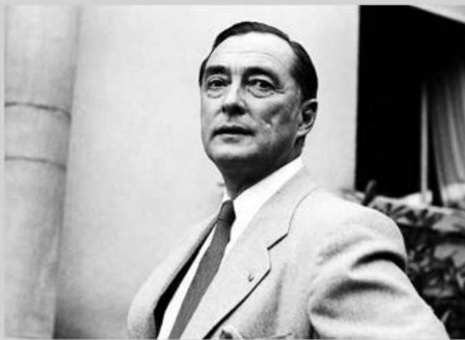
Richard von Coudenhove-Kalergi odbio je suradnju u ujedinjenju Europe kako ga je mislio provesti Hitler

Osim jedinstva Europe, Paneuropska unija promiče poštovanje načela supsidijarnosti, a pod krilaticom "grčka mudrost, rimsko pravo i kršćanska vjera" obuhvaća tri temeljne odrednice zajedničkoga europskog identiteta, u kojem su podjednako sudjelovali grčka filozofija, rimska pravna stečevina i kršćanska duhovnost.