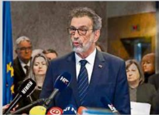
Cijenim ono što ministar Radovan Fuchs provodi u svom resoru

Sasvim sigurno. Ona jest spasila Europu te 2015., kada je Europa bila suočena s ogromnom krizom. Ali nije se išlo u daljnje rješavanje problema. Jedno je odgovoriti na izazov i spriječiti urušavanje, ali drugo je kada dođe do ponovnog zatvaranja granica, pa i mi smo imali žicu na granici s Mađarskom. Problem je Europe i nedostatak mlade radne snage koji se rješava nelegalnim uvozom migranata. To je, recimo, jako loše. Imamo i situaciju da jamčimo ljudska prava cijelom svijetu. Postavlja se pitanje može li Europa to. Može li otvoriti svoje gradove i granice svima koji su gladni i nesigurni bez posljedica za vlastite građane? Nizozemska je donedavno moralizirala svima, bila je među glavnim protivnicima hrvatskog ulaska u EU, a sada je dobila gotovo pa rasistički pokret u vladajućoj koaliciji. Njemačka se bori, ključno je kako će izaći iz ove krize. Hoće