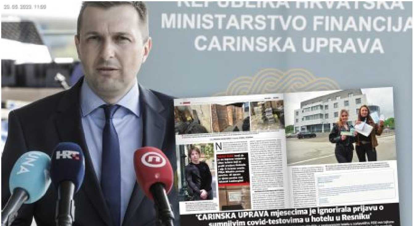
Carina tvrdi da su postupali oko covid-testova do izlaska Nacionala – pa zato nisu obavijestili podnositeljicu