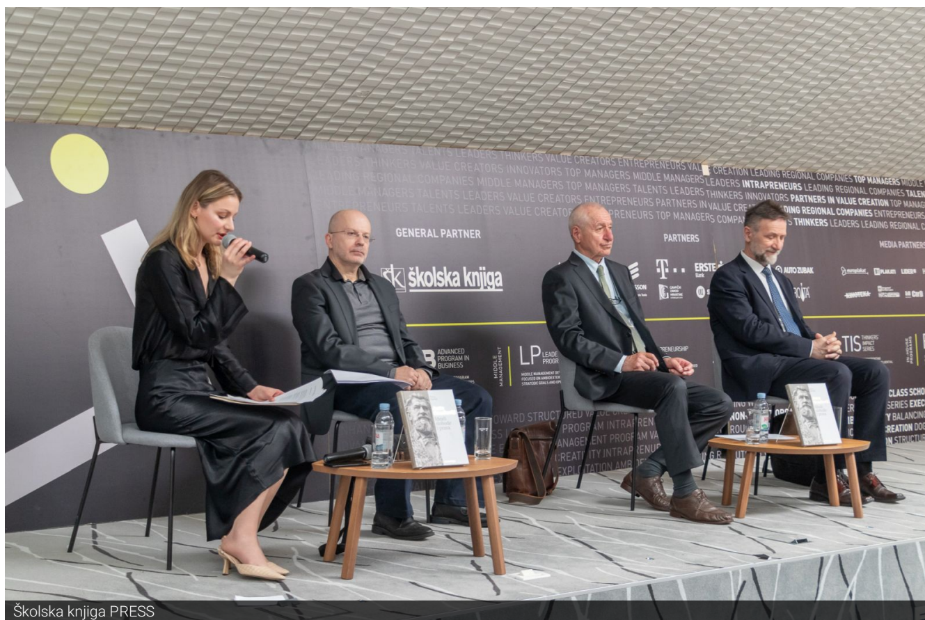
Školska knjiga PRESS