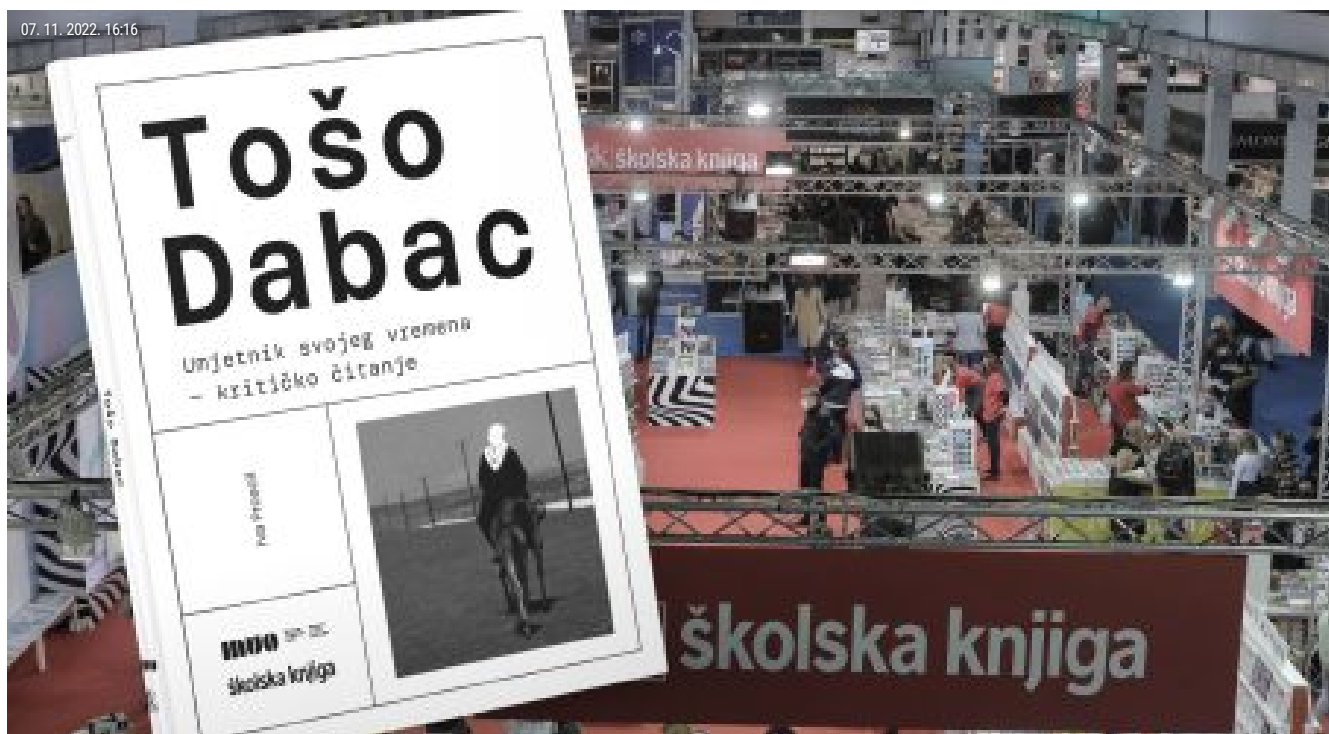
U četvrtak na Interliberu predstavljanje monografije 'Tošo Dabac: Umjetnik svojeg vremena'