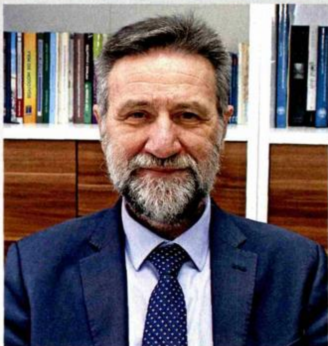
Bivši ministar obrazovanja RH protiv se ideologizaciji školskih programa